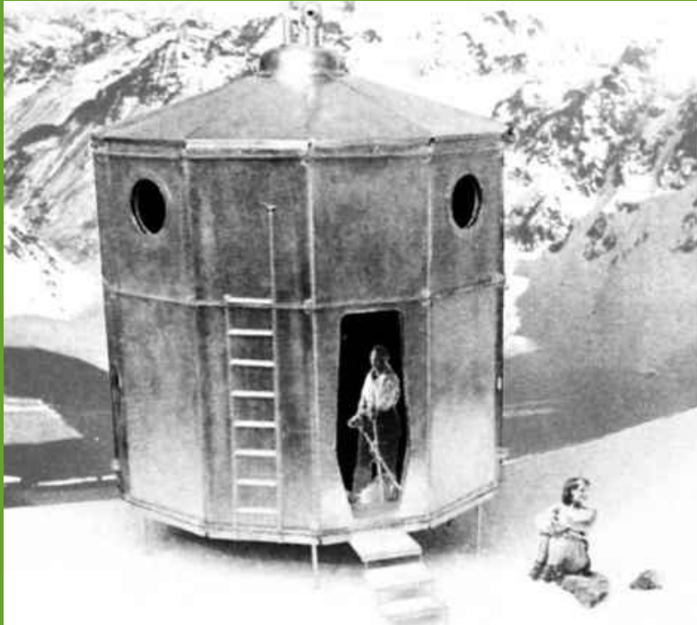
Projet de Refuge Tonneau , Pierre Jeanneret et Charlotte Perriand, 1938