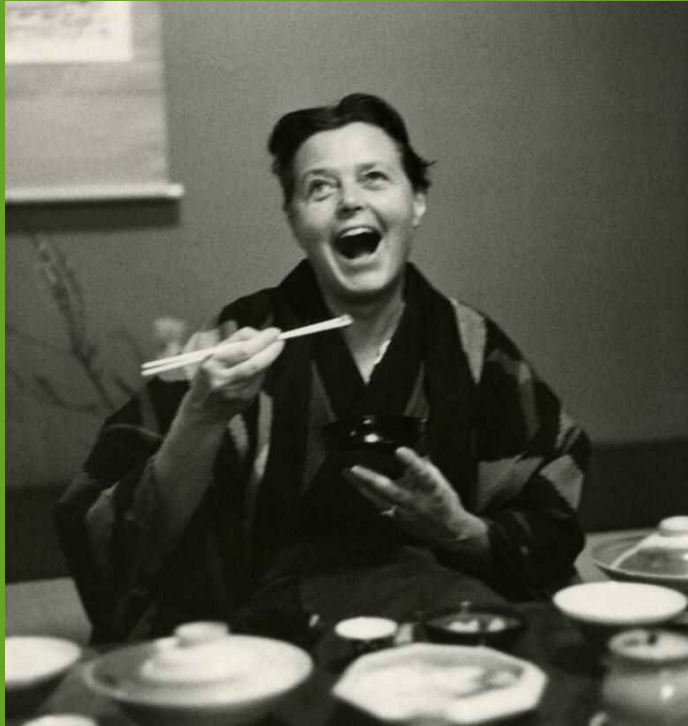
Charlotte Perriand lors de son deuxième voyage au Japon, 1955