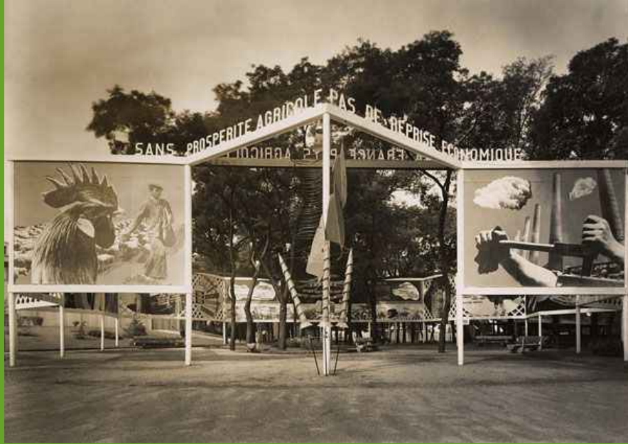
Charlotte Perriand et Fernand Léger, Pavillon du ministère de l'Agriculture, « Exposition internationale des arts et techniques » Paris, 1937