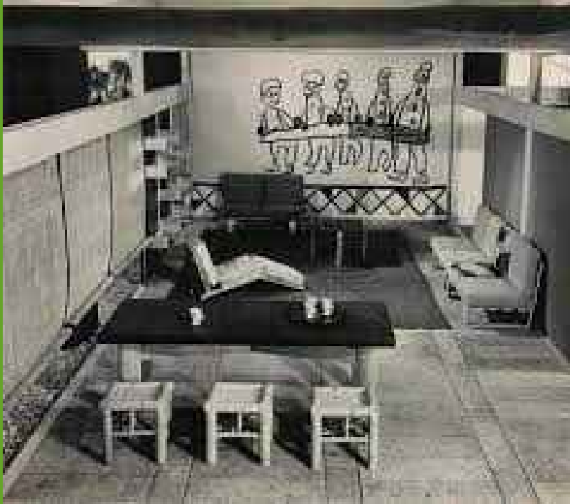
Exposition « Tradition, Sélection, Création », Tokyo, 1941