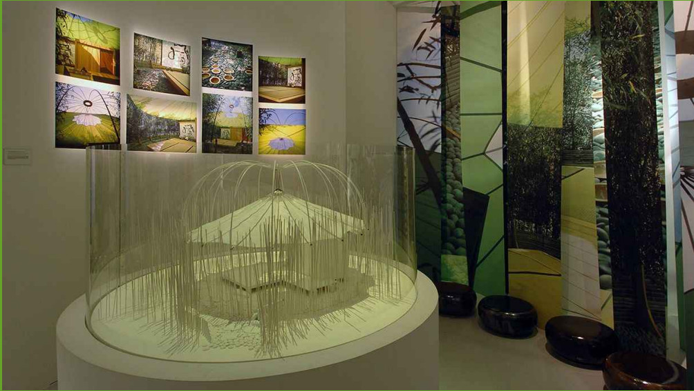
Maquette de la Maison de Thé, Exposition « Charlotte Perriand » au Centre Pompidou, 2005