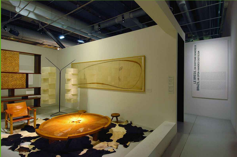
Vue d'une salle, « Exposition Charlotte Perriand » au Centre Pompidou, Paris, du 7 décembre 2005 au 10 avril 2006