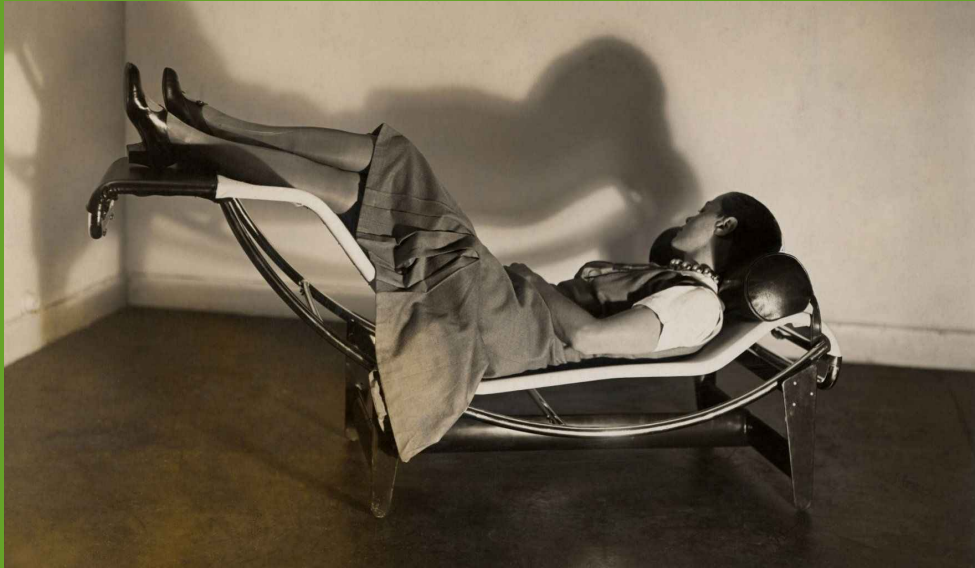
Charlotte Perriand sur la chaise longue , Le Corbusier, Pierre Jeanneret, Charlotte Perriand, 1928