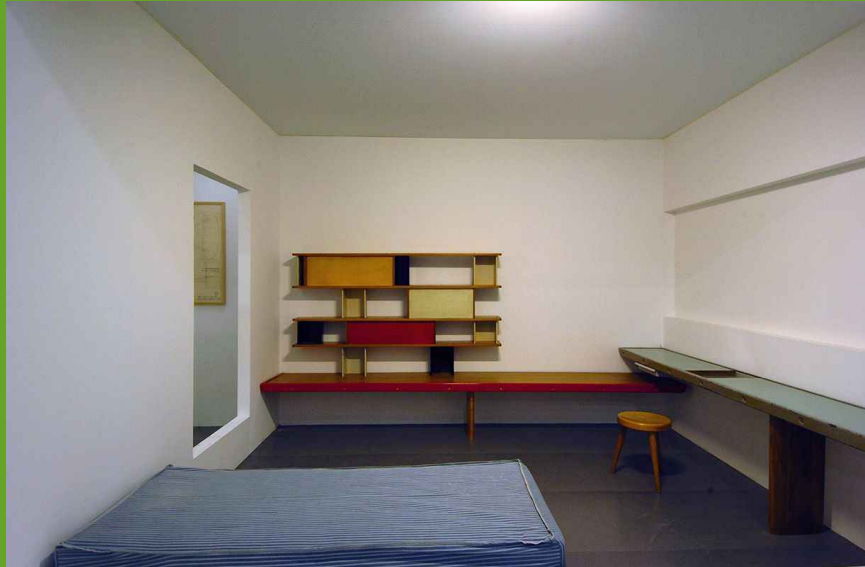
Reconstitution de l'intérieur d'une chambre de la Cité internationale universitaire, Exposition « Charlotte Perriand » au Centre Pompidou, 2005