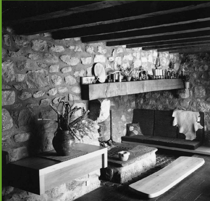
Chalet de Méribel, cheminée, 1960