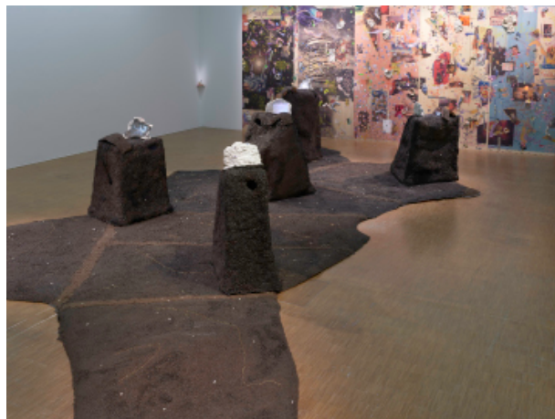
Ruche – Creole Garden in Normandie, 2024 Et en arrière-plan Safe Space for a passing history – Ère du Verseau 99999, 2024 Courtesy de l'artiste et Air de Paris, Romainville, Grand Paris © Adagp, Paris, 2024 Photo © Centre Pompidou, MNAM-CCI/Bertrand Prevot/Dist. GrandPalaisRmn

Dès 2025 et jusqu'en 2029, le Prix Marcel Duchamp sera présenté au Musée d'Art Moderne de Paris, dans le cadre d'un partenariat entre le Centre Pompidou, l'Adiaf et Musée d'Art Moderne de Paris / Paris Musées.