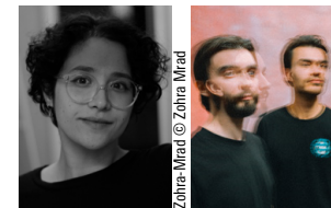
Zohra Mrad