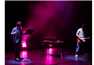
Le ciel ouvert © Anna Lalliet

Extraits choisis du texte de Nicolas Mathieu