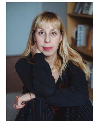
Lola Lafon

Lola Lafon est l'auteur de sept livres, tous traduits dans de nombreuses langues, dont La Petite Communiste qui ne souriait jamais (Actes Sud, 2014), récompensé par une dizaine de prix, Chavirer (Actes Sud, 2020), et Quand tu écouteras cette chanson (Stock, 2022), Prix Décembre, Prix Les Inrockuptibles, et Grand Prix des lectrices ELLE 2023.