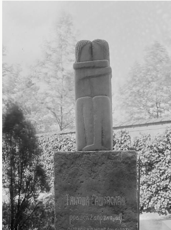
Constantin Brancusi, Le Baiser , 1909, cimetière du Montparnasse