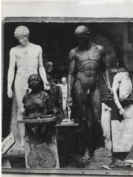
Vue de l'atelier au Mars Borghèse : L'Ecorché (1901), Tête d'expression (1901), Beaux-arts de Bucarest