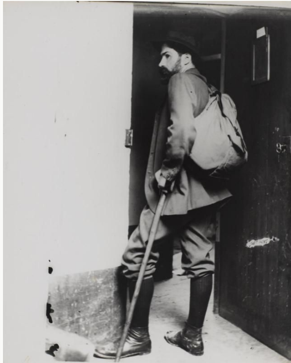
Anonyme, Brancusi en tenue de voyage, 1904