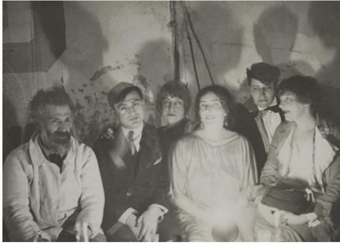
Brancusi, Tristan Tzara, Berenice Abbott, Mina Loy, Jane Heap et Margaret Anderson dans l'atelier