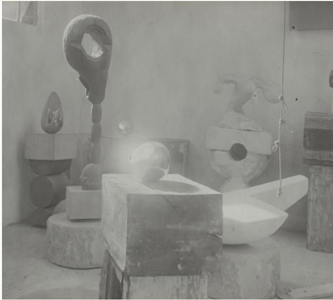
Vue d'atelier, vers 1945 -1946