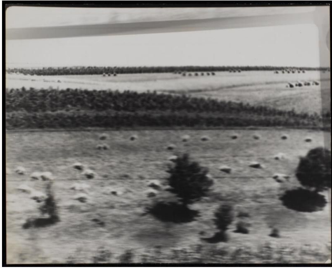
Campagne roumaine, vue du train, 1937 - 1938