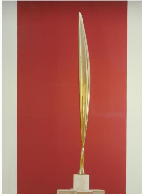
Constantin Brancusi, L'Oiseau dans l'espace , 1941