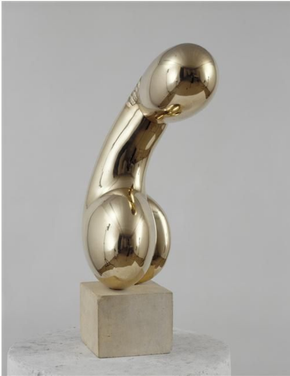
Constantin Brancusi, Princesse X , 1915