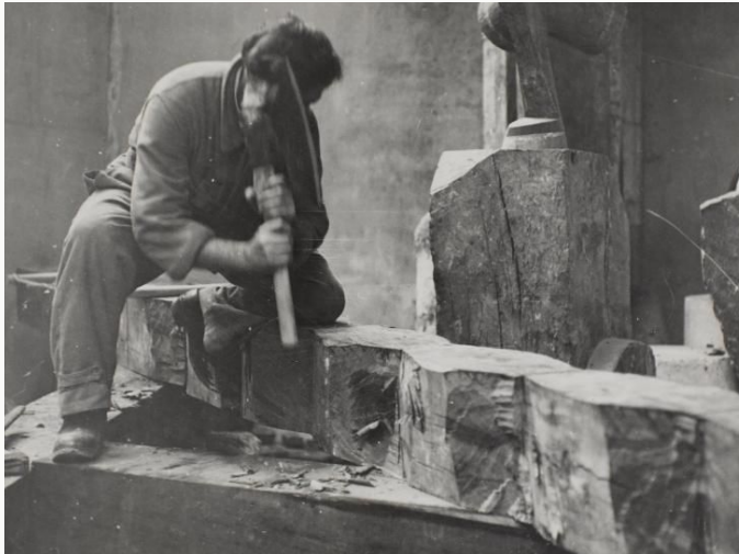
Brancusi, accroupi, taillant à la hache une Colonne sans fin , 1924