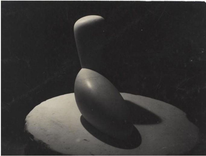
Constantin Brancusi, Léda , avant septembre 1921