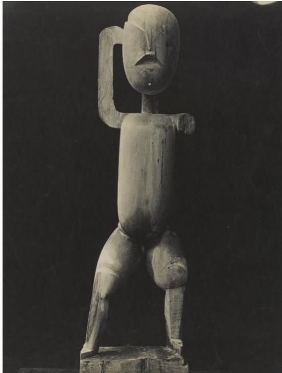
Constantin Brancusi, Le premier pas , 1913