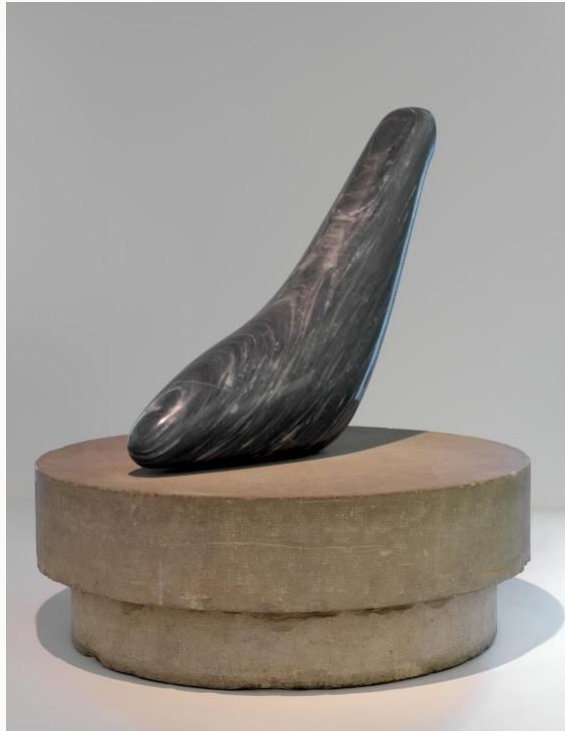
Constantin Brancusi, Phoque II , 1943