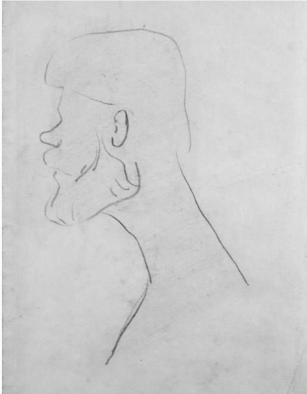
Autoportrait de profil, vers 1907 - 1915